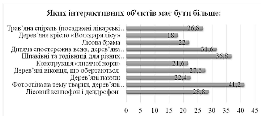
Рис.1 Інтерактивні об'єкти, обрані туристами

Зібрана інформація дозволила побачити які саме об'єкти, хотіли б бачити респонденти в якості освітніх унаочнень. Найбільш популярним потенційним освітнім об'єктом в лісі стала фотостіна на тему тварин, дерев'яні макети тварин. Її бажають зустріти в лісі 55,6% респондентів. Серед конкретних груп спостерігаємо наступний розподіл: 50,5% – туристи та відвідувачі лісу, 57,7% – представники освітніх установ, 72,9% – люди з особливими потребами. Другим за популярністю виявився об'єкт – «шпаківні та годівниці для різних тварин, пташиний годівник». Його б не проти спостерігати в лісі 46,1% респондентів. В розрізі груп маємо наступну картину: 29,2% – люди з обмеженими можливостями, 45,1% – туристи та відвідувачі лісу, 56,8% – представники освітніх установ (рис.1; рис.2).