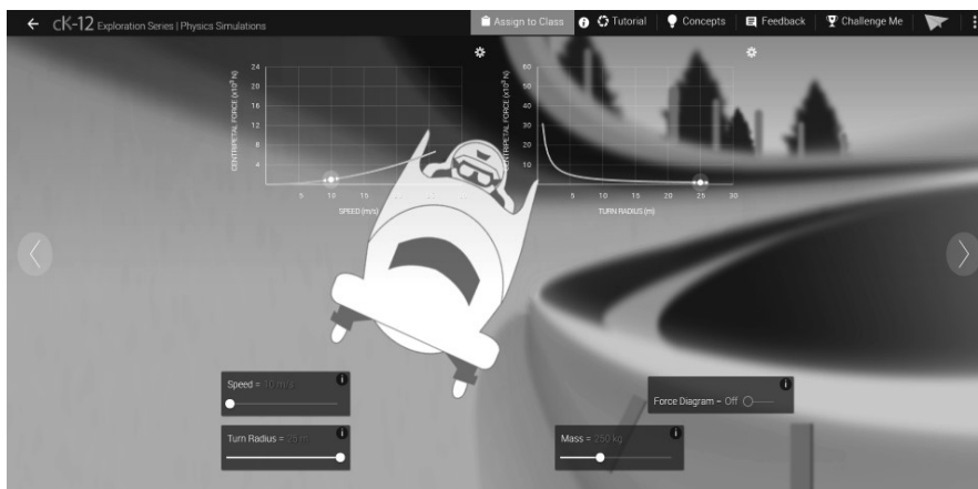
Рис. 4. Дослідження залежностей швидкості, маси та радіусу повороту бобслею ( www.ck12.org )

На третьому етапі учні моделюють ситуації, нотують результати в таблиці та узагальнюють висновки (рис. 4).