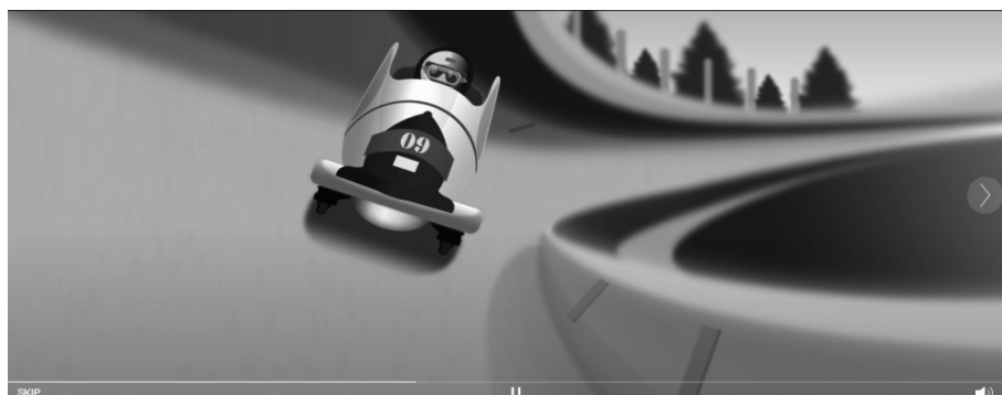
Рис. 3. Демонстрація руху бобслею – анімація