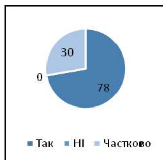
Рис. 2. Результати опитування з виявлення активізації мисленнєвої діяльності здобувачів початкової освіти при застосуванні методу ситуаційного аналізу.