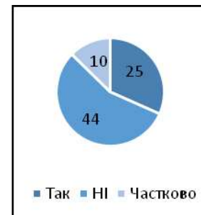
Рис. 3. Результати опитування з виявлення думки щодо активізації мисленнєвої діяльності здобувачів початкової освіти

Результати відповідей засвідчують значний інтерес вчителів до застосування методу аналізу ситуацій в початковій школі.