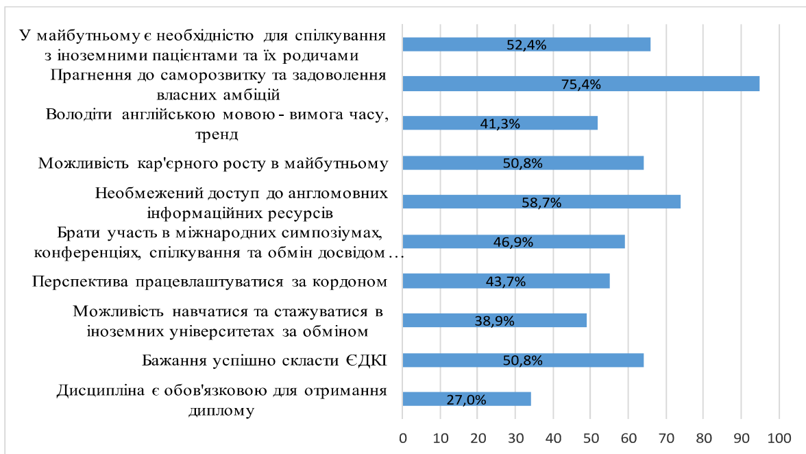
Рис.1. Аналіз результатів дослідження мотиваційної сфери студентів Національного медичного університету імені О.О. Богомольця

німи мотивами (скласти іспити, отримати диплом), демонструють «споживацьке ставлення до учіння, навчальний матеріал засвоюється для близької цілі і після відтворення швидко забувається» [7, с.161]. Крім зниження якості та обсягу засвоєних знань спостерігаються спроби уникнення студентами виконання завдань творчого чи пошукового характеру, віддаючи перевагу простим шаблонним вправам.