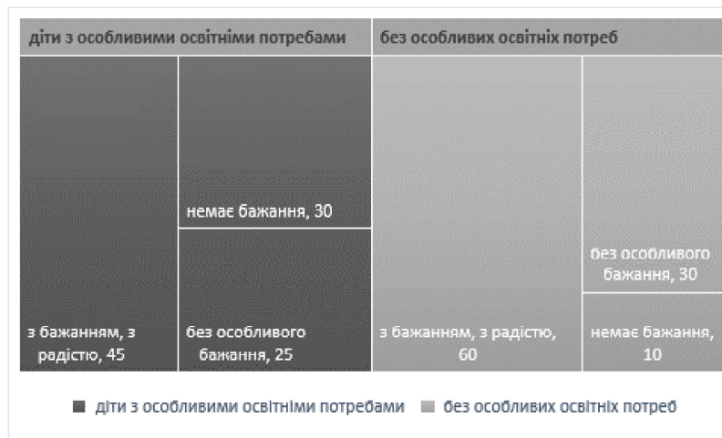
Рис.1. Бажання дітей молодшого шкільного віку відвідувати шкільні заняття

Серед дітей без особливих освітніх потреб значно більша частка тих, хто відвідує шкільні заняття з бажанням та радістю на відміну від дітей з особливими освітніми потребами (рис.1).