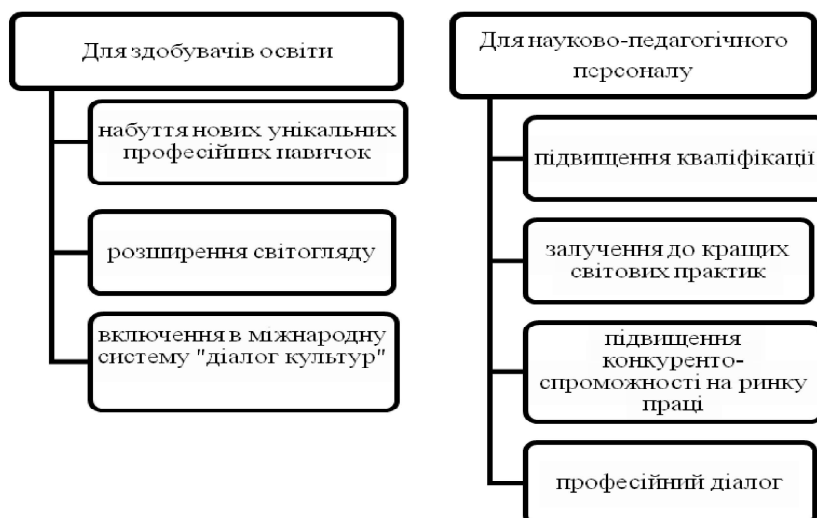
Рис. 2. Перелік результатів академічної мобільності здобувачів освіти і науково-педагогічного персоналу

Безумовно, такі програми подвійних дипломів є найбільш популярними: зацікавленість в українських студентів викликає престижність диплома закордонного закладу вищої освіти, здобувачам освіти пропонується ознайомлення з унікальними освітніми дисциплінами, які представлені на місцевому ринку освітніх послуг, подібні програми сприяють не лише розвитку співробітництва держав у науковій, освітній, інформаційній та інших галузях, а й роз-