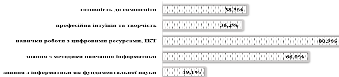
Рис.2. Візуалізація результатів опитування студентів