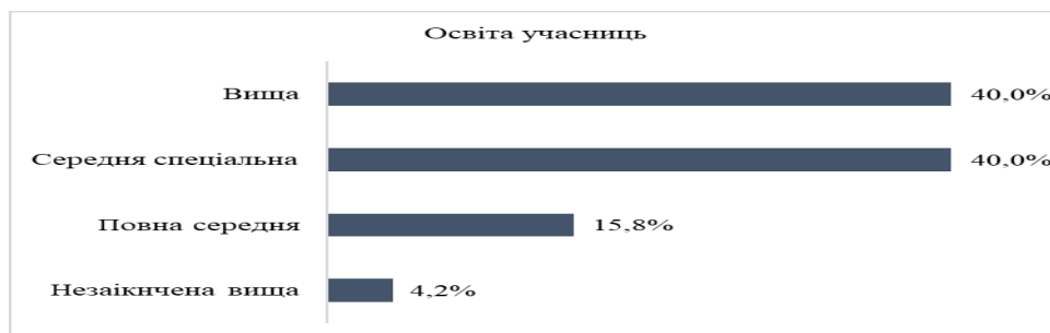
Рис. 2. Освіта учасниць дослідження

Сімейний статус учасниць (рис. 3) був представлений такими групами: 60,5% – заміжні жінки, 21% – розлучені, 16,8% повідомили, що не мають стосунків, 1,7% – вдови.