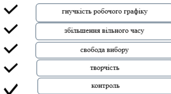
Рис. 4. Образ майбутнього після завершення навчання

Щодо очікувань після здобуття нових фахових компетенцій після завершення навчання, то учасниці зазначали такі позиції (рис. 4): гнучкість робочого графіку, яка дозволяла б у разі виникнення непередбачуваних ситуацій оперативно розв'язувати родинні чи особисті питання; збільшення обсягу вільного часу, який можна витратити на дозвілля чи дітей; збільшення свободи вибору, пов'язаної з професійною діяльністю (місце роботи, кількість вихідних днів, тривалість відпочинку); збільшення складової, пов'язаної з творчістю у їх професійній діяльності; збільшенням рівня внутрішнього, а не зовнішнього контролю за своїм кар'єрним зростанням та рівнем доходу.