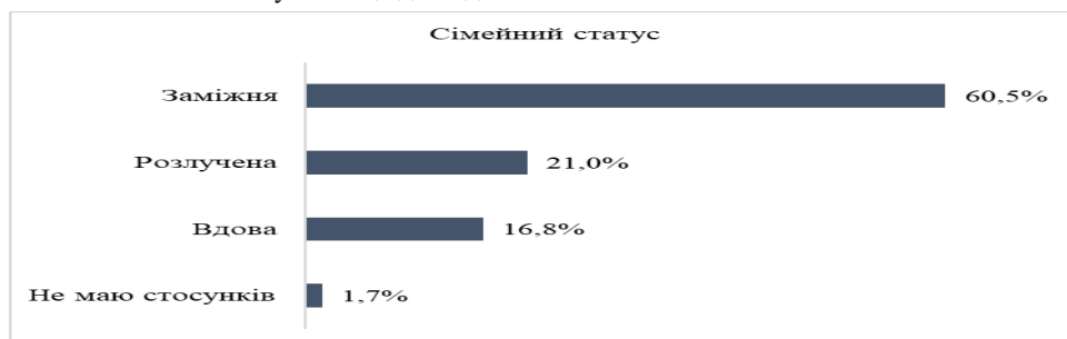
Рис. 3. Сімейний статус учасниць дослідження