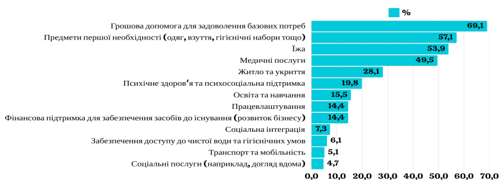
Рис. 1. Відповіді на запитання «Які потреби ви відчуваєте найбільше? Визначте п'ять найбільш пріоритетних».

Розуміння конкретних та змінних потреб з перспективи бенефіціарів є важливим для налаштування гуманітарних відповідей та забезпечення їх актуальності (рис.1).